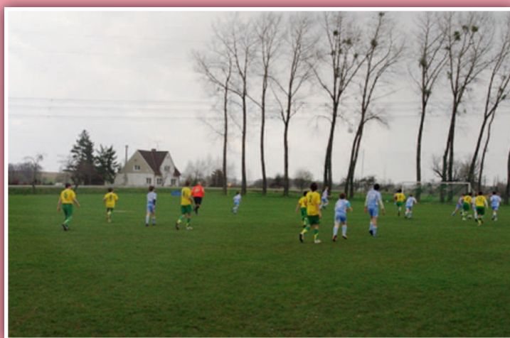
Fotbalové hřiště využívané TJ v Dolních Tošanovicích

Tělovýchovná jednota Tošanovice vznikla v roce 1961. Členskou základnu tvoří zejména obyvatelé Horních a Dolních Tošanovic. Za svou dlouholetou historii se věnovala různým sportům. V posledních letech se nejvíce uplatňuje oddíl kopané. Také se aktivně věnuje práci s dětmi, které vede ke sportu a zdravému životnímu stylu. Tělovýchovná jednota je novým členem MAS přijatým na konci roku 2014.