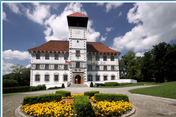
Zámek ve Staré Vsi nad Ondřejnicí