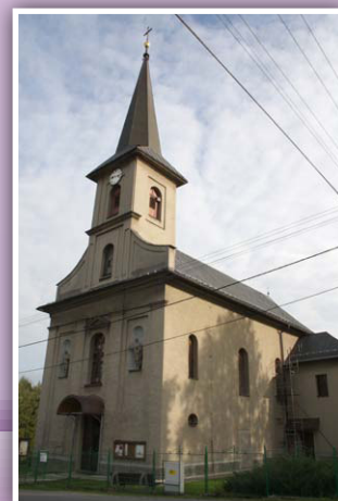
Kostel sv. Filipa a Jakuba v Dobratcích

K životu farnosti patří také vytváření společenství (model farnosti jako ro-