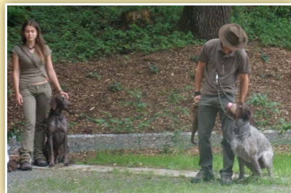
Ukázka dovedností loveckých psů na dětském dni