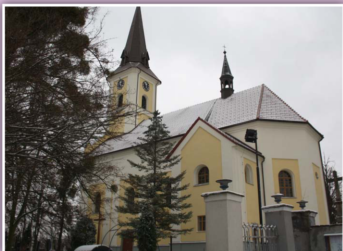
Farní kostel svatého Jakuba Většího v Horních Domaslavicích

dina) napříč generacemi. K tomu slouží setkávání v menších skupinách, práce s dětmi při výuce náboženství, setkávání farníků po nedělní bohoslužbě v prostorách fary, a také akce společenského a kulturního rázu, jako je například koncerty nebo farní ples.