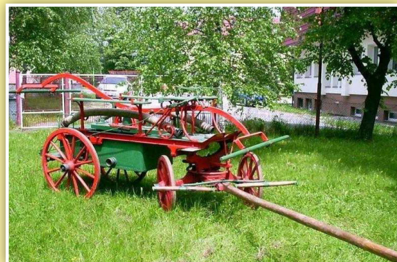
Historická stříkačka