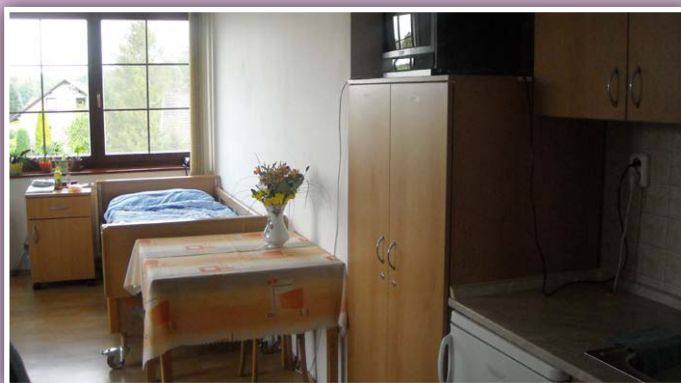
Pokoj v domu Sv. Josefa v Ropici