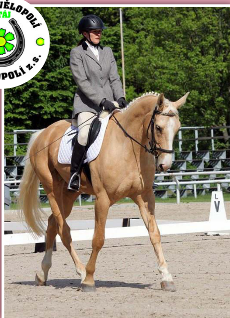
Členka JK Vělopolí, z. s. na závodech

Jezdecký klub Vělopolí vznikl v březnu 2014, jako dobrovolný klub majitelů a přátel koní provozující jezdecký zaměřený na nižší sport, rekreační jízdu a agroturistiku. Založen byl dlouholetými příznivci koní a života okolo nich. Nedílnou součástí klubu je pony školička JURÁŠEK, která nabízí využití dětem od 3 do 12 let. Cílem spolku je vytvořit místo smysluplného setkávání lidí bez rozdílu věku a zdravotního stavu tak, aby všichni – děti i dospělí – zde mohli trávit volný čas, relaxovat a sportovat.