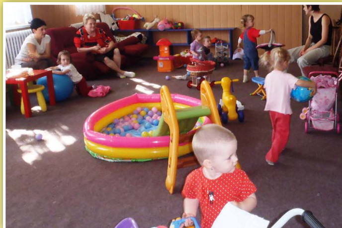
Aktuální fotografie ze schůzky

Spolek je členem MAS od roku 2012. Jeho členky se zapojují do aktivit MAS určených dětem.