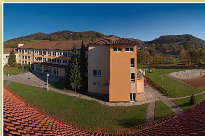
Areál školy v Hukvaldech