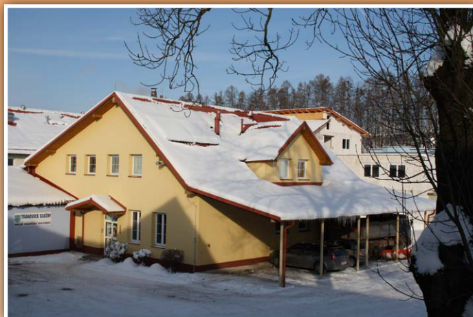
Kotelna na biomasu ve venkovské podnikatelské zóně v Třanovicích - sídlo společnosti

Zakládající člen MAS Pobeskydí. Má dlouholeté zastoupení v orgánech MAS.