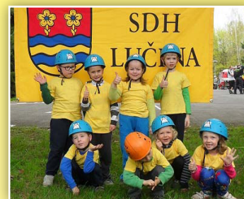
9. ročník Vachalíkova memoriálu

Sbor požární ochrany v Lučině byl založen na své ustavující schůzi dne 5. února 1956. Stejně jako obec Lučina, která vznikla po stavbě vodního díla Žermanice na území dříve katastrálně přináležejícím k Soběšovicím a Domaslavicím, tak i u zrodu sboru stáli v první řadě členové sboru požární ochrany těchto obcí. Spolek je novým členem MAS od roku 2014.