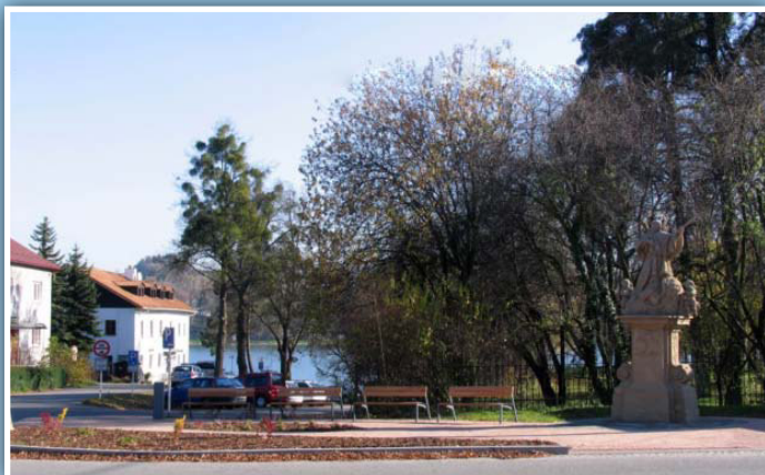
Sv. Jan Nepomucký v Těrlicku