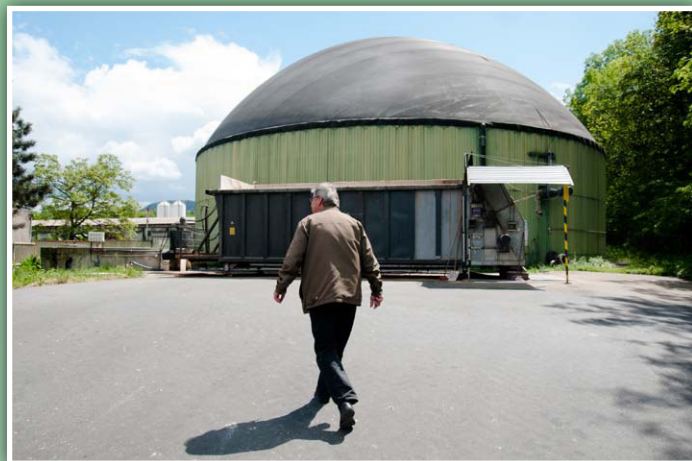
Bioplynová stanice TOZOSu spol. s r.o. v Dolních Tošanovicích