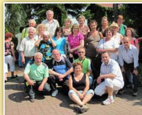
Členská základna

Proč být zahrádkářem v dnešní době? Pro sdílení radosti z okrasných prvků i celku v zahradách kolem domů; hledání nových cest pro soužití s životním prostředím; poznávání svých sousedů z dolního či horního konce vesnice nebo se jen účastnit společenských akcí jako příznivec dobré zábavy. Spolek je jedním z nových členů MAS přijatých v roce 2014.