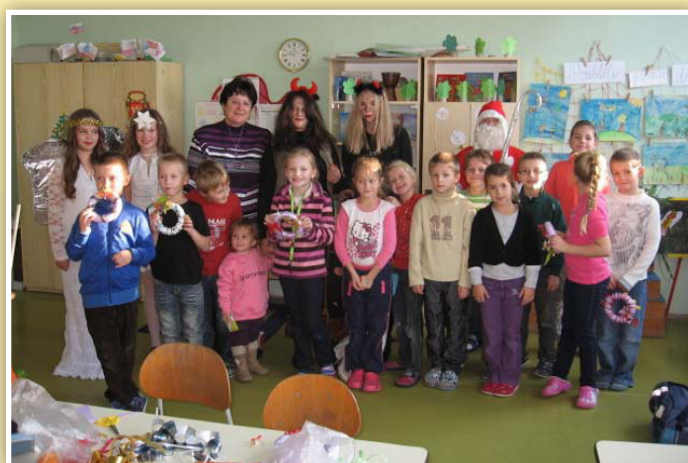
Mikulášské hrátky v ZŠ Těrlicko