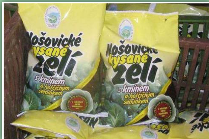
Nošovické kysané zelí