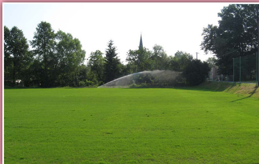
Sportovní hřiště TJ Dobruška