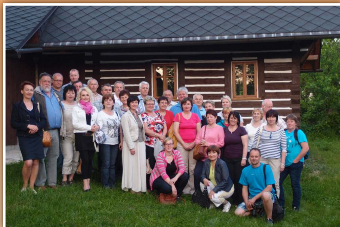
Účastníci studijní cesty organizované ŠOV Třanovice, o. p. s. v roce 2014 do Centra rozvoje Česká Skalice

Škola obnovy venkova byla založena v roce 2001 jako organizace bez právní subjektivity při obci Třanovice a měla sloužit pro potřeby obcí mikroregionu povodí Stonávky. Postupem času se její působení rozšířilo na obce v Moravskoslezském kraji, jelikož ŠOV dlouhodobě organizačně zabezpečuje sekretariát Spolku pro obnovu venkova Moravskoslezského kraje. Škola organizuje semináře, kulaté stoly, konference a studijní cesty s různorodou tematikou obnovy venkova a spolupráce venkovských komunit. Se získáním právní subjektivity od roku 2012 se ŠOV profiluje jako iniciační centrum udržitelného rozvoje. K aktivitám přibýlo environmentální vzdělávání, výchova a osvěta, příprava projektů na využití obnovitelných zdrojů energie a účinnější využití energetických zdrojů. Od téhož roku škola také působí jako konzultační středisko pro projekt Virtuální univerzita 3. věku.