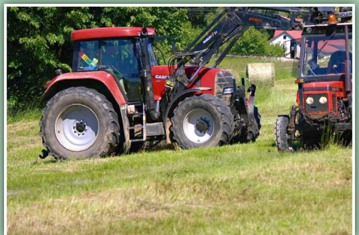
Balíkování v AGRO - DOMINIK

Zakládající člen MAS Pobeskydí. Aktivně pracuje v pracovní skupině Hospodářství.