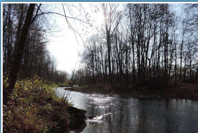
Řeka Stonávka