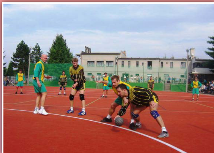
Národní házená ve Staré Vsi nad Ondřejnicí

Historie tělovýchovného hnutí ve Staré Vsi nad Ondřejnicí sahá do roku 1906, kdy byl založen Sokol. Vedle národní házené si v posledních letech udržují nebo získávají pozice sporty jako futsal, florbal, stolní tenis, badminton, cyklistika a volejbal. Ženské složky se věnují aerobiku, józe a v poslední době i cvičení pilates, břišním tancům a módní zumbě. Všechny složky využívají areál, tvořený krytou halou, nově rekonstruovaným polyfunkčním sálkem a venkovním hřištěm s umělým povrchem. Nový člen MAS přijatý v roce 2014.