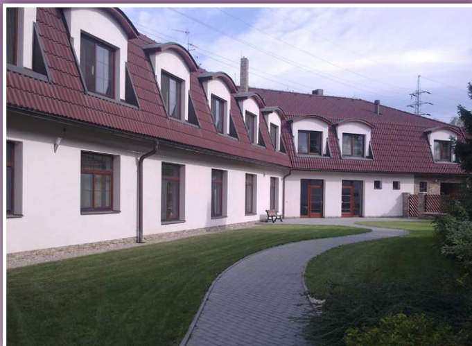
Dům Sv. Josefa v Ropici