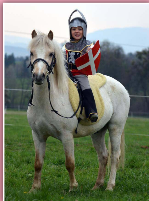
Hrátky v pony školičce

Spolek je jedním z nových členů MAS přijatých v roce 2014. Aktivně se zapojuje do činnosti pracovních skupin.