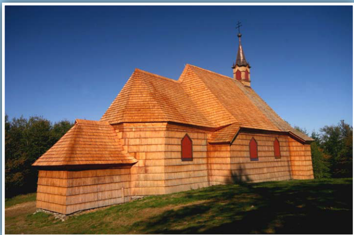
Dřevěný kostel sv. Antonína Paduánského na Prašivě

Sdružení obcí povodí Morávky vzniklo na konci 90. let 20. století a sdružuje 10 obcí soustředěných kolem řeky Morávky a jejích přítoků. Celému regionu vévodí Lysá hora a vodní nádrž Morávka. Účelem svazku je spolupráce a koordinace úkolů v oblasti kultury, hospodářství a sociálního rozvoje členských obcí, zlepšování životního prostředí, podpora rozvoje turistického ruchu, spolupráce a pomoc v případě mimořádných událostí a vzájemná výměna zkušeností a společné získávání různých forem dotací. Zakládající člen MAS Pobeskydí. Má dlouholeté zastoupení v orgánech MAS. Jeho zástupci se aktivně účastní pracovních skupin.