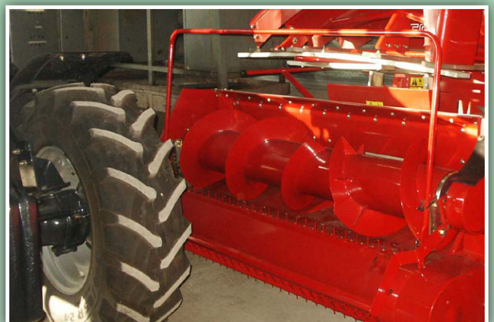
Družstvo Raškovice bylo jedním z prvních žadatelů v MAS Pobeskydí - technika na sklizeň biomasy