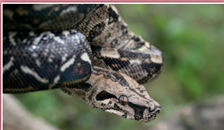
Farma se zabývá rovněž chovem hroznýšovitých hadů

Farma je novým členem MAS přijatým na konci roku 2014.