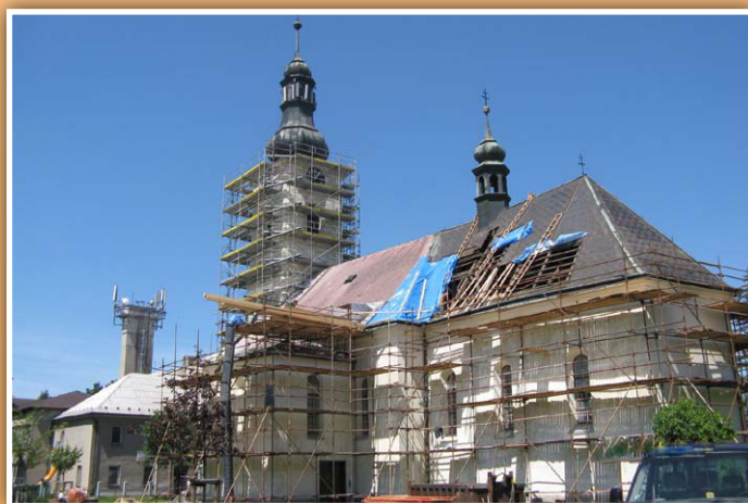
Z činnosti firmy - oprava kostela v obci Dobrá v roce 2012

Zakládající člen MAS. Má dlouholeté zastoupení v orgánech MAS. Aktivně se účastní pracovní skupiny Životní prostředí a infrastruktura.