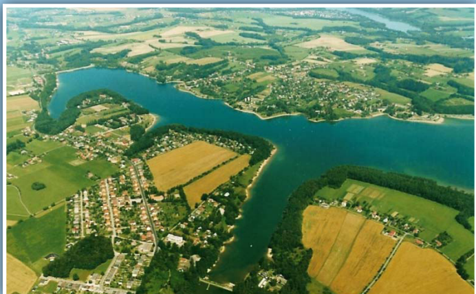
Okolí Žermanické a Těrlické přehrady

Zakládající člen MAS Pobeskydí. Má dlouholeté zastoupení v orgánech MAS. Jeho zástupci se aktivně účastní pracovních skupin.