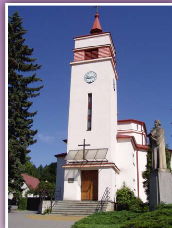
Kostel SCEAV v Třanovicích

jsou zastoupeny všechny věkové skupiny, fungují zde hudebně-pěvecké skupiny mládeže, pěvecké sbory (smíšené a mužský), dechový soubor a další aktivity. U přilehlého evangelického hřbitova vznikl v roce 2013 Památník Jiřího Třanovského (Georgius Transcius Muzeum), jehož rod pochází z naší vesnice. Tento památník chce být důstojným připomenutím této významné postavy dějin našich i okolních slovanských národů. Jiří Třanovský byl nazván slovanským Lutheřem. Jeho významná díla Cithara sanctorum (kancionál) a Phiala odoramentorum (kniha modliteb) ovlivnila národní, kulturní i duchovní odkaz po mnohé generace. Stálá expozice o životě, díle a jeho odkazu je inspirací k zamyšlení i v naší době. Od roku 2003 působí ve sboru pastor Tomáš Tyrlík. Nový člen MAS přijatý v roce 2014.