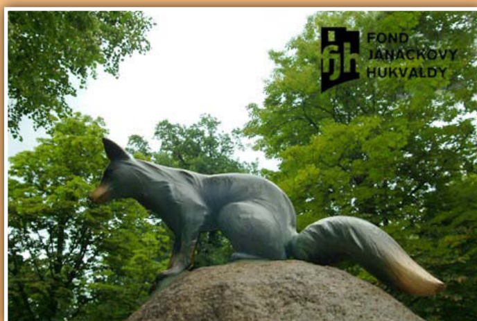
Liška Bystrouška v Hukvaldech

Zakládající členové „Fondu-Janáčkovy Hukvaldy“, navazují na umělecký odkaz největšího z hukvaldských rodáků a velikána světového hudebního skladatelství Leoše Janáčka (1854-1928), jsou si vědomi povinnosti nedat zaniknout kulturnímu kreditu obce Hukvaldy a oblasti Hukvaldska vůbec, respektují tradice hudebních slavností a festivalů s historickými prvopočátky v r. 1938. Vrcholem jejich činnosti je každoroční Mezinárodní hudební festival Janáčkovy Hukvaldy. Spolek je novým členem MAS od roku 2014.