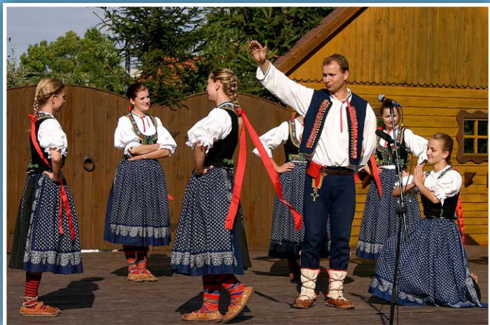
Valašský vojvoda z Kozlovic na Sochových slavnostech ve Lhotce