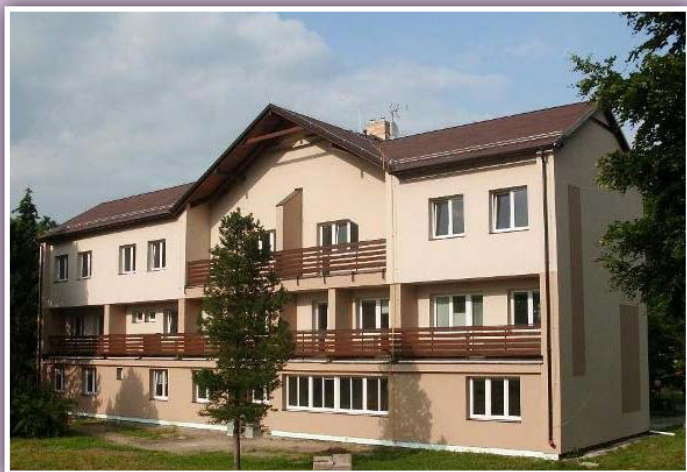
Domov pro osoby se zdravotním postižením v Komorní Lhotce

Integrovaný sociální ústav Komorní Lhotka (příspěvková organizace) vznikl v roce 1992 spojením domova pro seniory a domova pro osoby se zdravotním postižením. Snahou této příspěvkové organizace je poskytovat kvalitní sociální služby s akcentem na individuální potřeby klientů. Domov pro seniory poskytuje komplexní služby pro starší občany od pobytové služby, stravování, sociálního poradenství až po zdravotnickou péči a volnočasové aktivity. Domov pro osoby se zdravotním postižením nabízí bydlení komunitního typu pro osoby s mentálním postižením. Součástí služeb jsou i služby zdravotní péče, zprostředkování kontaktu se společenským prostředím i volnočasové aktivity a zájmové kroužky. Organizace je novým členem MAS od roku 2014. Aktivně se účastní pracovní skupiny Společnost.