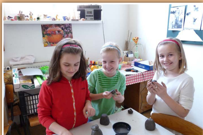
V keramické dílně