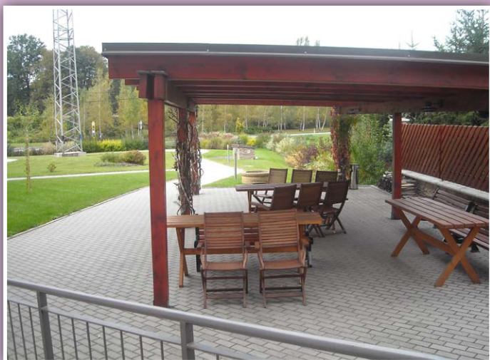
Terasa u domu Sv. Josefa v Ropici

Společnost je jedním z nových členů MAS přijatých v roce 2014.