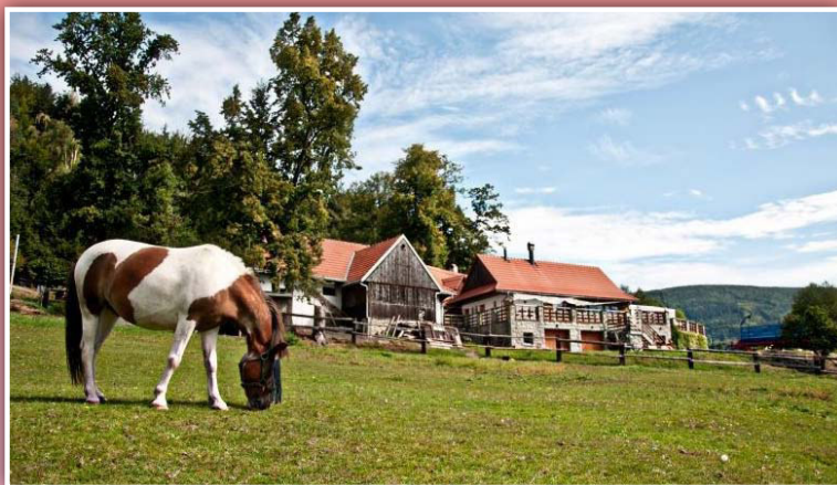
Pension Jízdárna v údolí řeky Morávky

Společnost, která vznikla v roce 1996 provozuje pension Jízdárna na Morávce a jezdeckou školu. V rámci svých služeb se věnují dětem a požádají zde prázdninové tábory s výukou jízdy na koních, dětské dny, mikuláše apod. Součástí pensionu je restaurace, ve které dbají na tradiční českou kuchyni i místní speciality. Společnost je novým členem MAS od roku 2014. Aktivně se účastní pracovní skupiny Hospodářství.