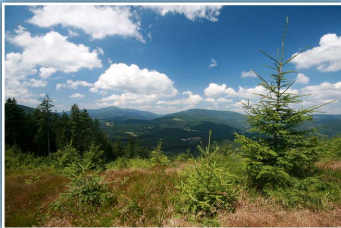
Beskydy z Polomky na Morávce