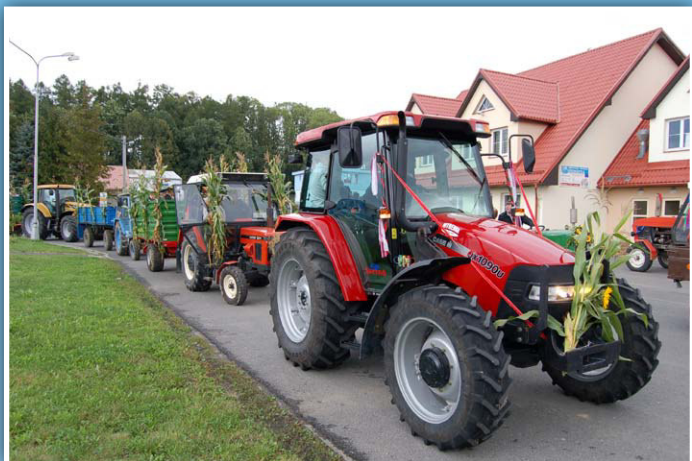
Dožínky v Třanovicích

Sdružení obcí povodí Stonávky je svazkem 10 obcí, ležících v povodí Stonávky pod beskydskou horou Godulou v zázemí měst Třinec a Český Těšín. Sdružení bylo založené v roce 1998 s cílem řešit společné problémy a posílit spolupráci mezi jednotlivými obcemi i se zahraničními partnery. Realizuje řadu projektů zaměřených na společenský život, podporu dětí a mládeže, cestovní ruch i odpadové hospodářství. Velkým pomocníkem sdružení i jednotlivých obcí v oblasti projektového managementu je obecně prospěšná společnost Stonax o.p.s., která rovněž sídlí v Třanovicích. Zakládající člen MAS Pobeskydí.