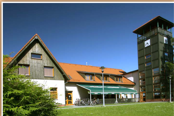
Nová Husarůvka v Soběšovicích sídlo nejen LUSTONu o.p.s.